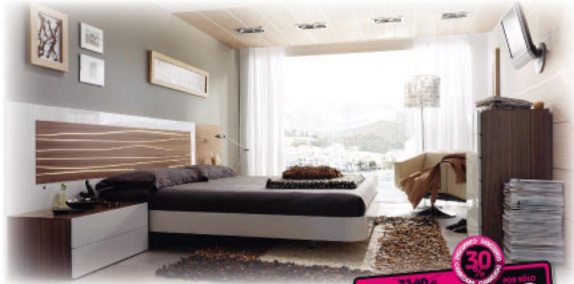
[16] Dormitorio de matrimonio en laca blanca y nogal americano, con luz. (Precio para cabecero, bancada y 2 mesitas).