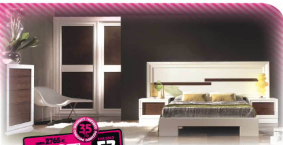
[13] Dormitorio de matrimonio en pino macizo combinado blanco con nogal. (Armario opcional no incluido en el precio).