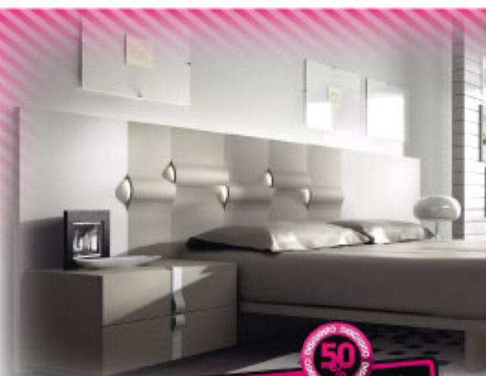
[11] Dormitorio de matrimonio en color blanco/gris y negro.

50% DESCUENTO COMPARADO CON EL PRECIO ORIGINAL antes 3180 € 1560 € por sólo 50 € AL MES