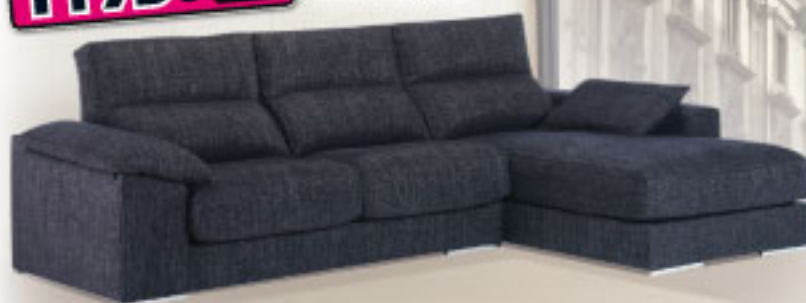
[21d] Sofá con chaiselongue.