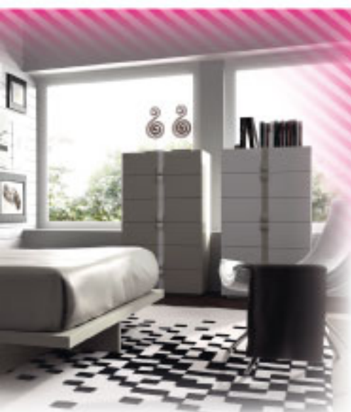
[12] Dormitorio de matrimonio moderno en tonos arenas. (Precio para cabecero, bancada y 2 mesitas).